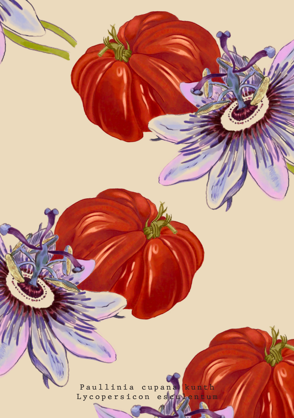
Paullinia cupana kunth Lycopersicon esculentum