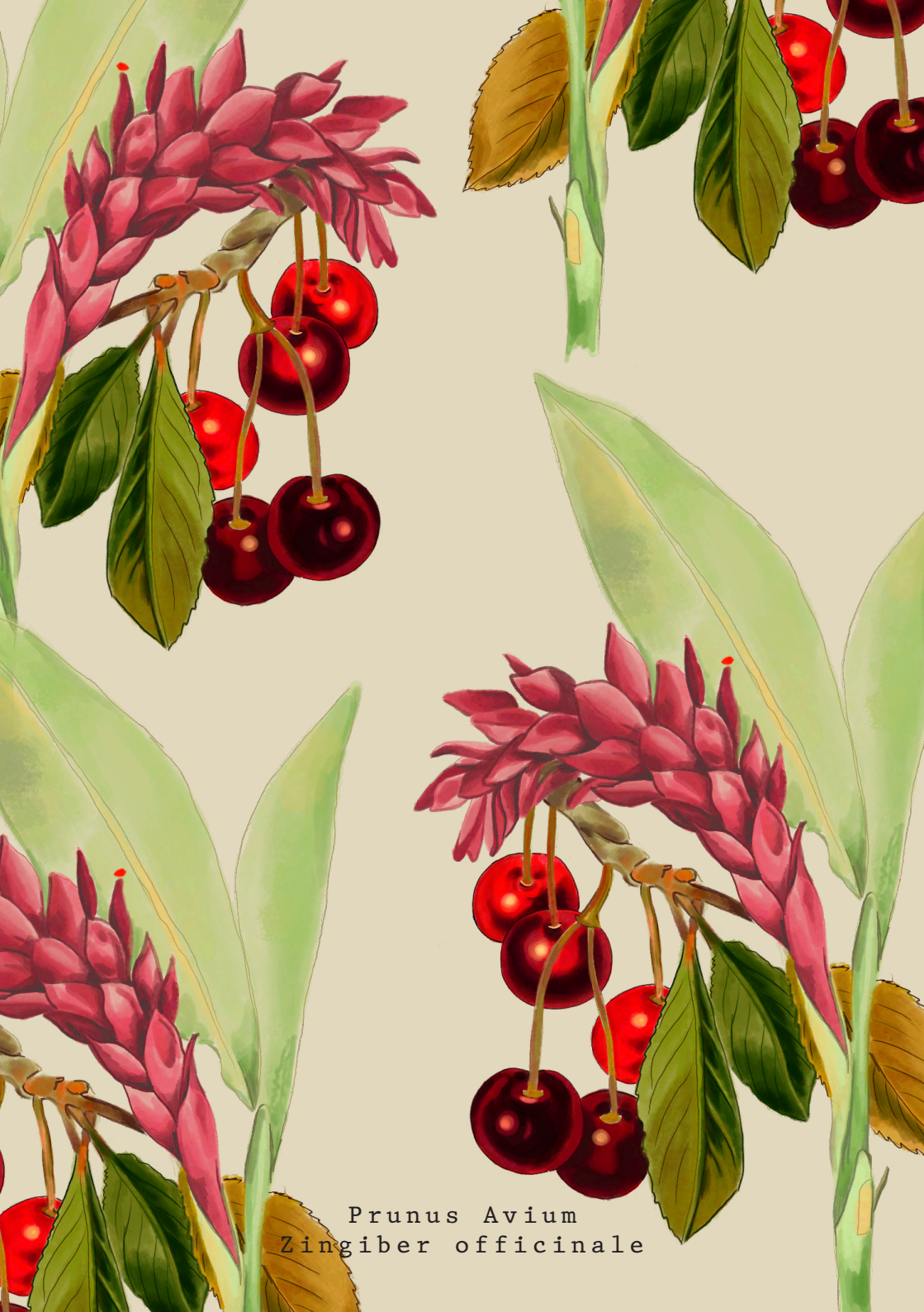
Prunus Avium Zingiber officinale