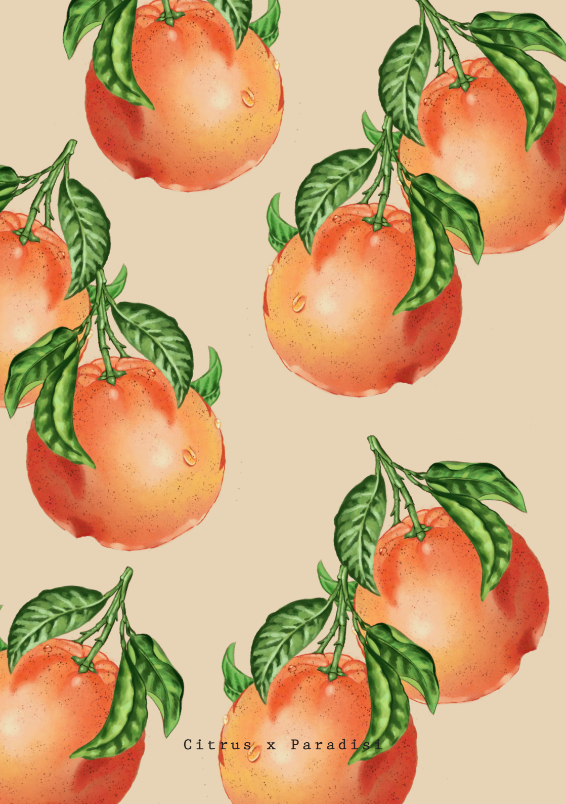
Citrus x Paradisi