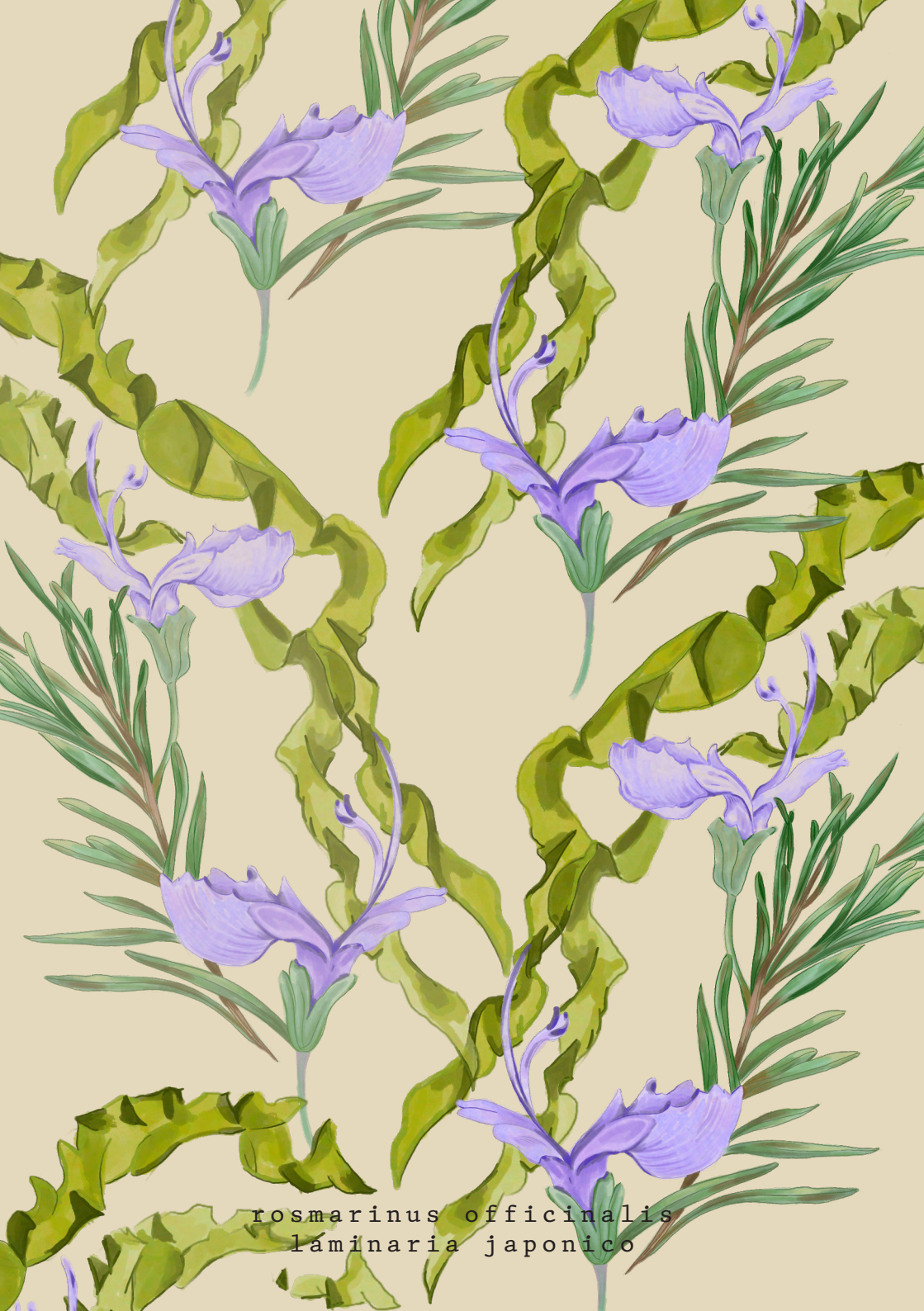
rosmarinus officinalis laminaria japonico