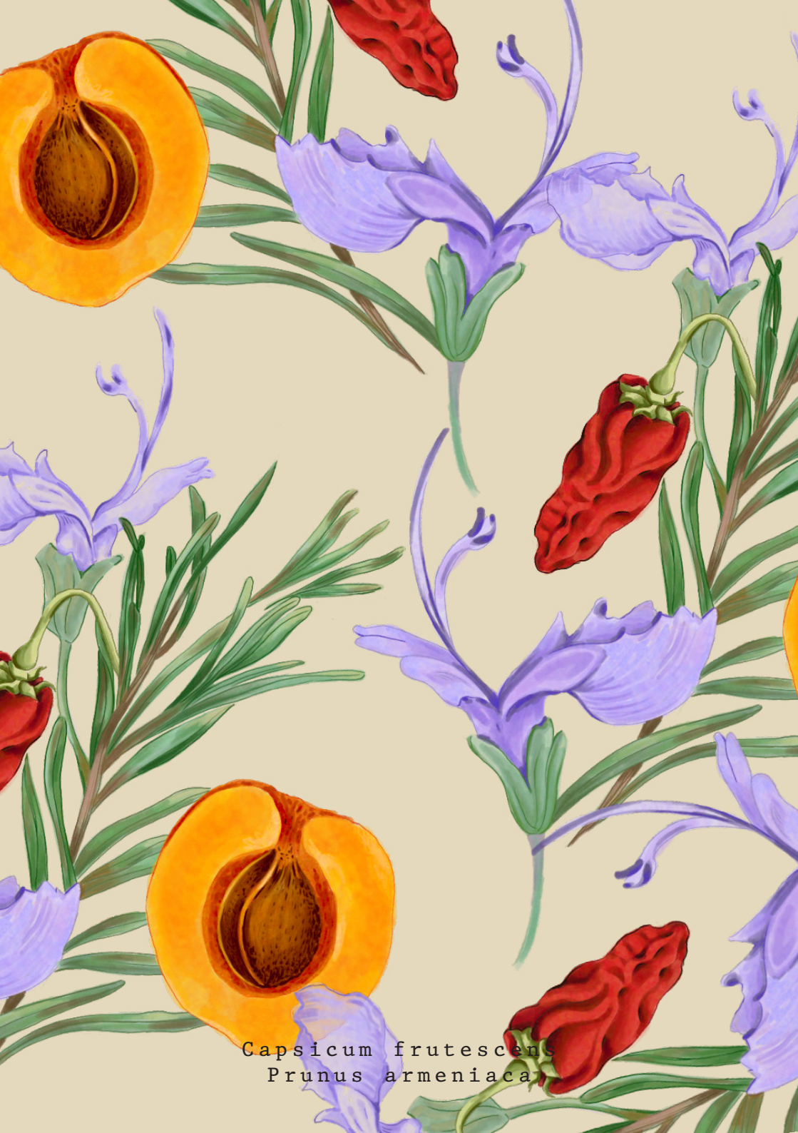
Capsicum frutescens Prunus armeniaca