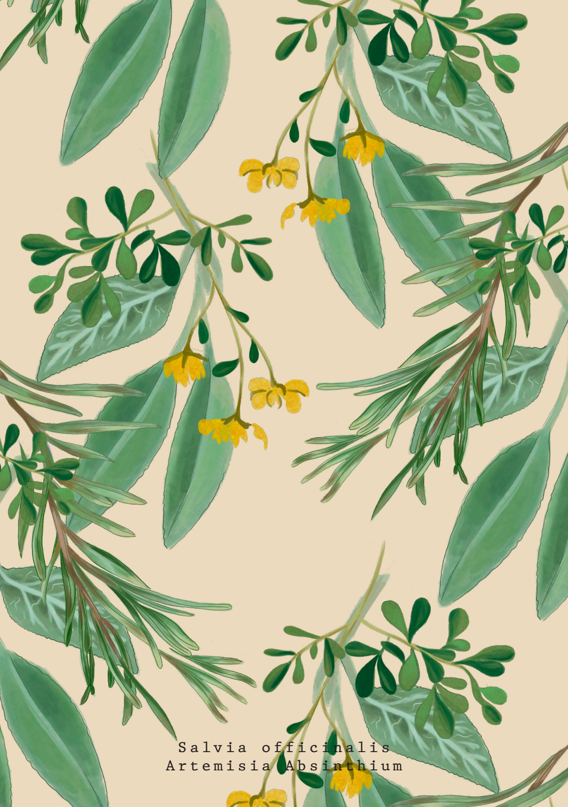
Salvia officinalis Artemisia Absinthium