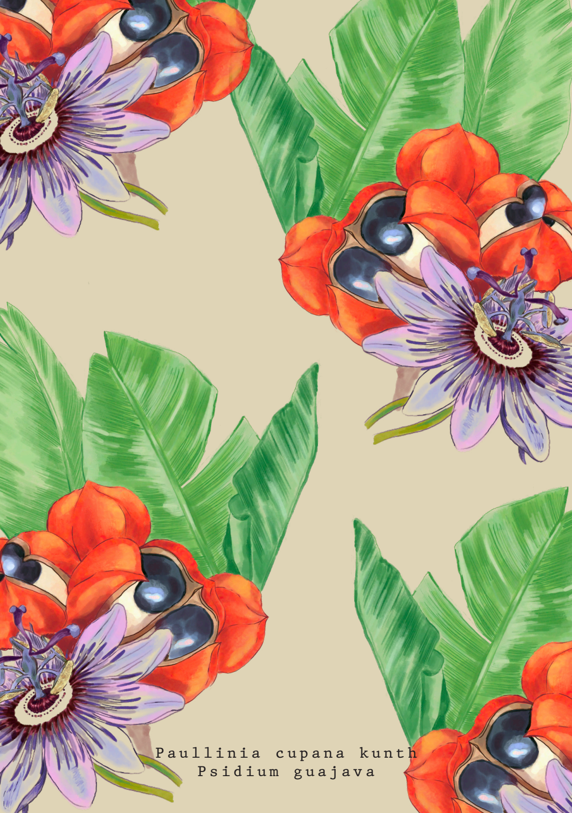
Paullinia cupana kunth Psidium guajava