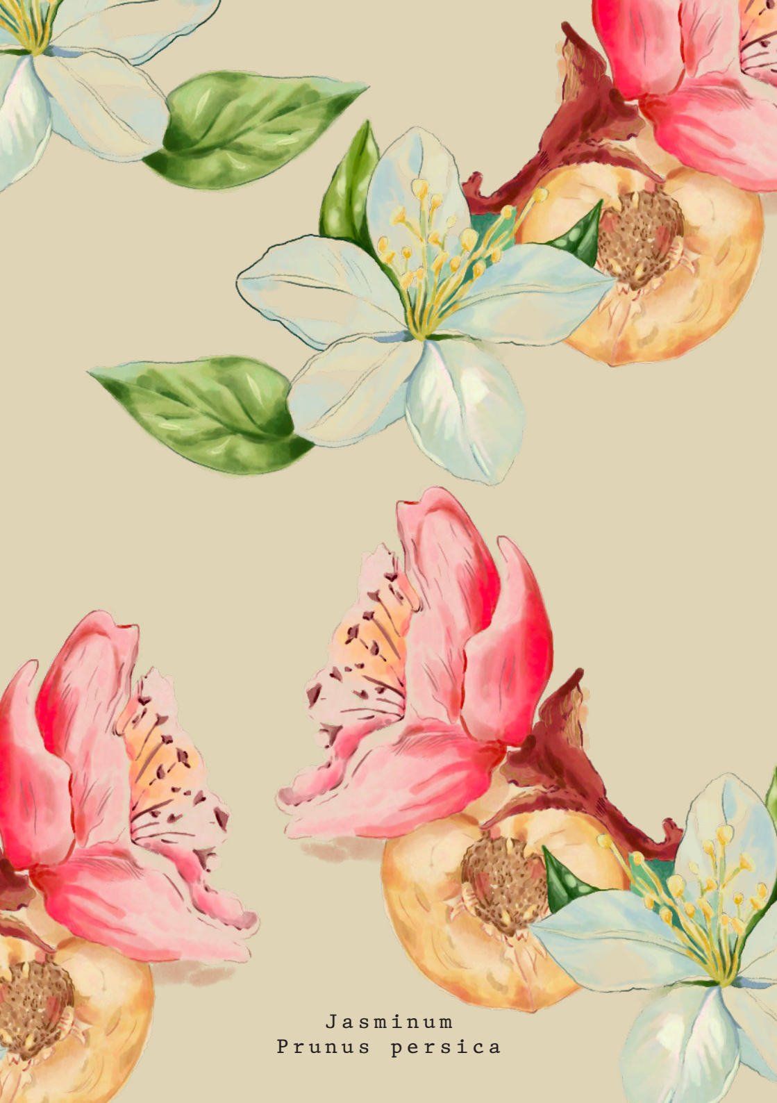
Jasminum Prunus persica